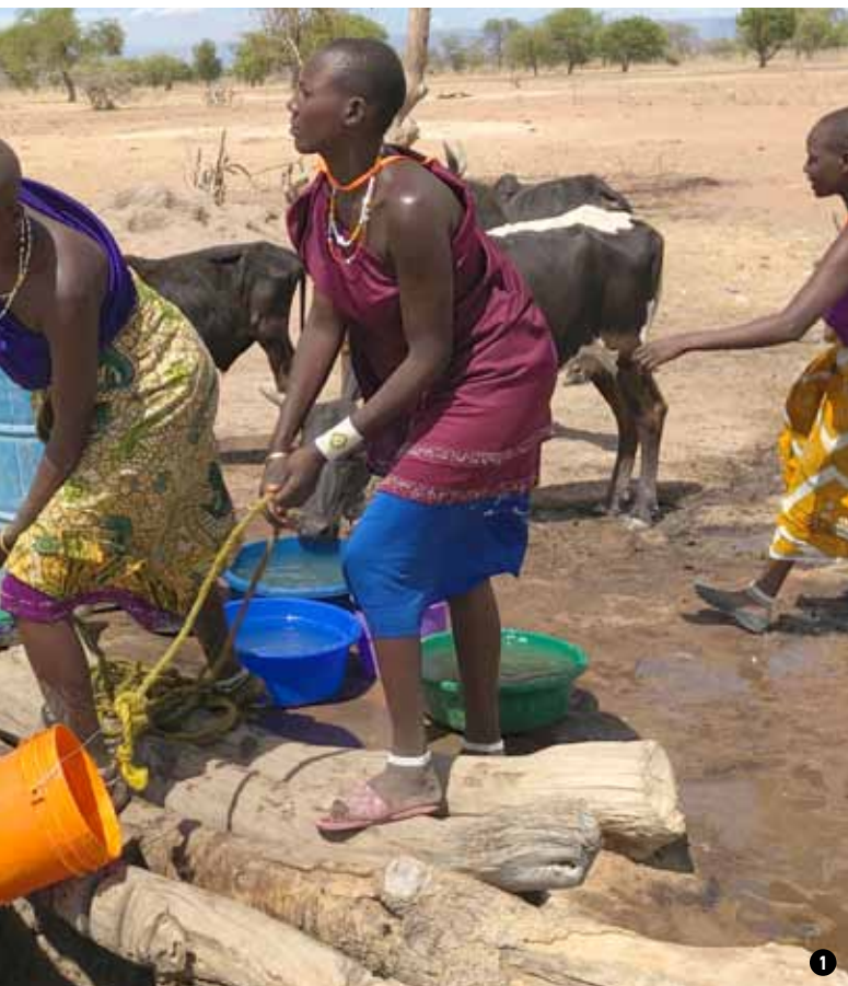
Photo de couverture | À Lusaka en Zambie les enfants apprennent à lire avec la méthode phonétique Letterland. 1 | Femmes Massaïs au vieux puits, loin du village. Le nouveau est maintenant dans le village.